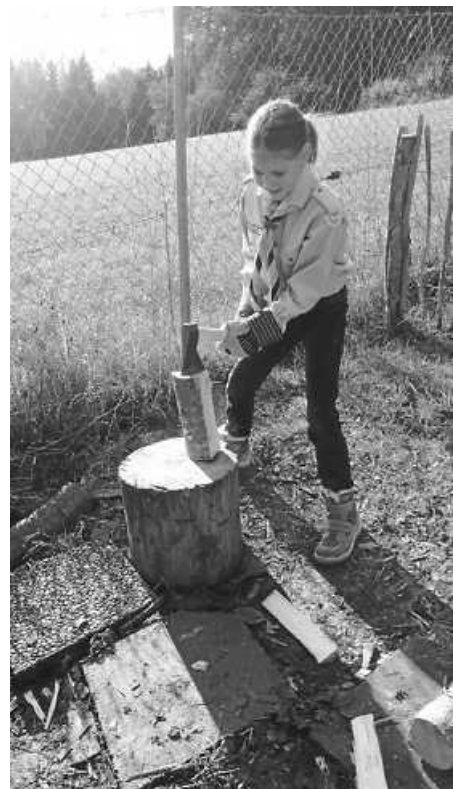
So wird's richtig!