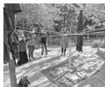
Hand in Hand

Am 16. und 17. Oktober 2023 haben wir unsere pädagogischen Tage gehabt. Wir hatten Besuch vom Initiativpark Böblingen von epizentrum e. V. Gemeinsam ging