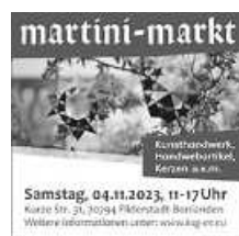
Plakat: M. Woide