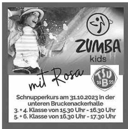
Plakat: P. Ullrich

Hast du Lust zu tanzen? Dann bist du bei uns genau richtig!