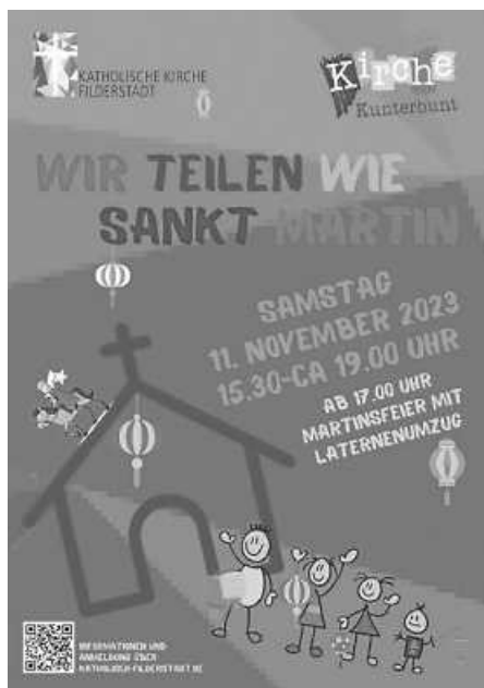
Plakat: Reinhold Walter