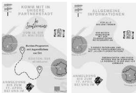
Plakate: Rebecca Eisenreich

Gemeinsam mit Jugendlichen vor Ort werden wir zum Beispiel Baumklettern, Picknicken am See, eine Husky-Tour machen et cetera. Alle Informationen sind auf dem Flyer oder auf unserer Homepage zu finden. (Rebecca Eisenreich)