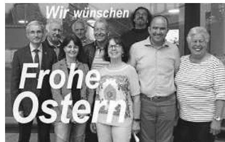
Die Fraktion der Freien Wähler Filderstadt e. V. wünscht allen frohe, gesegnete Ostern.

Die Verwaltung erscheint bei der Flut der Aufgaben, die ihr immer mehr aufgebürdet werden, zunehmend überlastet, Bürgerinnen und Bürger müssen auf Beratungstermine, Entscheidungen und die Klärung von Fragen unsäglich lange warten, und die Krankheitswelle bei städtischen Beschäftigten nimmt zu. Auch wichtige Vorhaben brauchen zu lange bis zur Umsetzung.