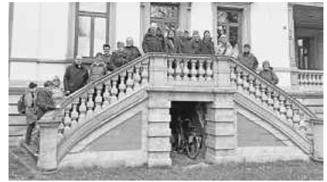
Der Heimatverein auf den Stufen der Villa Laiblin in Pfullingen.

durch Theodor Fischer. Als kleine Überraschung gab zum Schluss in Reutlingen das architektonische Vorbild des Fabrikgebäudes in Plattenhardt (heute „Domberger“) von 1924. (ba)