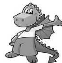
Grafik: Reinhold Walter