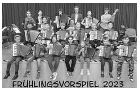
Kinder und Jugendliche beim Frühlingsvorspiel 2023.

Stolz präsentierten die Akkordeonschüler von Rolf Weinmann ihr Können beim