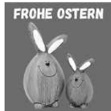
Grafik: P. Ullrich