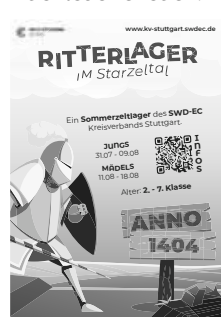
Plakat: SWD EC

Heute haben wir gute Neuigkeiten. Das Warten ist bald vorbei und in ungefähr vier Monaten schlagen wir im Starzeltal unsere Zelte auf. Sei dabei, wenn wir in unsere Ritterburg einziehen und als Rittersleut' gemeinsame Abenteuer erleben.