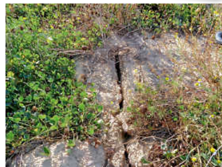
Immer mehr Hitzetage mit über 30 Grad Celsius führen zu ausgedörrten Äckern.