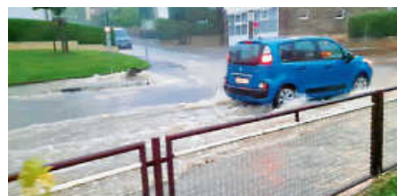
Starkregen und Überschwemmungen sind ebenfalls Folgen des veränderten Klimas.