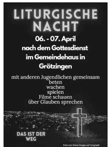
Plakat: GKG Neckar-Aich