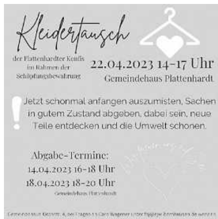
Plakat: EKG Plattenhardt