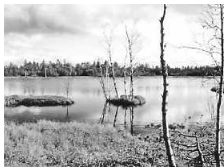
Wildseemoor, Schwarzwald.

Beim Abbau von Torf werden Moore, deren Entstehung Jahrtausende gedauert hat, entwässert. Dabei wird nicht nur der Lebensraum seltener Tiere und Pflanzen zerstört. Es entweichen auch erhebliche Mengen an CO 2 , die im Moor gebunden sind, in die Atmosphäre – was den Klimawandel beschleunigt. Moore bedecken weltweit zwar nur drei Prozent der Landfläche, speichern aber doppelt so viel Kohlenstoff wie alle Wälder unserer Erde. Sie sind also entscheidend für ein intaktes Klima. Torf ist viel zu wertvoll, um ihn zum Gärtnern zu verwenden. (U.Forschner)