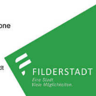
Gestaltung: SiMeos Media / Referat für Wirtschaft und Marketing Stadt Filderstadt Geobasisdaten: ©Landesamt für Geoinformation und Landentwicklung Baden-Württemberg

Stadtverwaltung Filderstadt Aicher Straße 9 70794 Filderstadt Telefon: 071170030