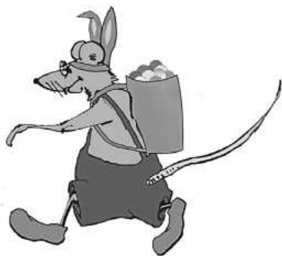
Grafik: Joachim Mierau