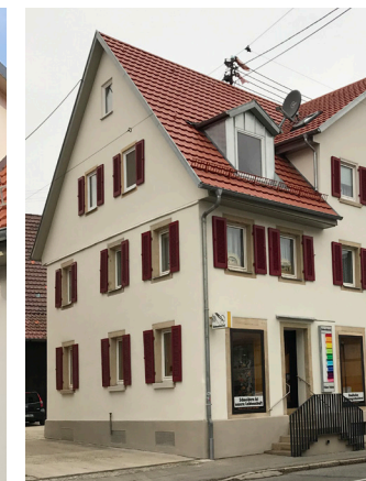
Beispiele von bereits realisierten Sanierungsmaßnahmen in der Innenstadt von Bernhausen