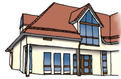
Bürgerhaus Sonne Sielminger Hauptstraße 44