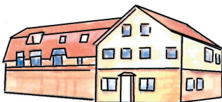
Filderstadtwerke Brühlstraße 41