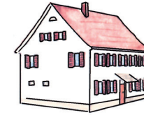
Bürgeramt Grötzing Straße 7