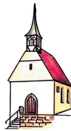
Stadtarchiv Lange Straße 83