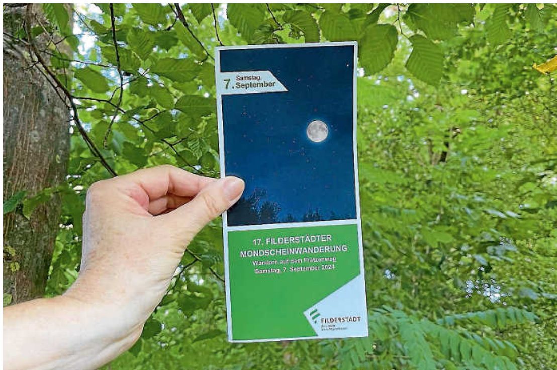
Auf zur Mondscheinwanderung am 7. September.