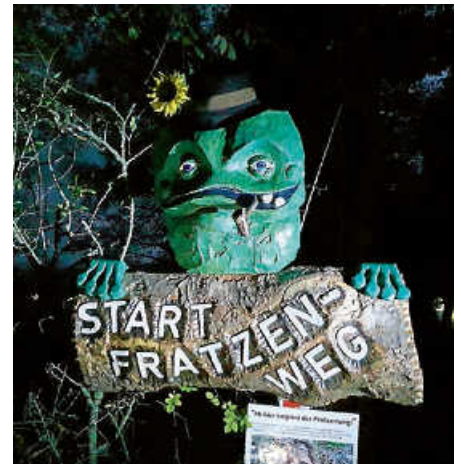
Die Mondscheinwanderung führt über den beleuchteten Fratzenweg.