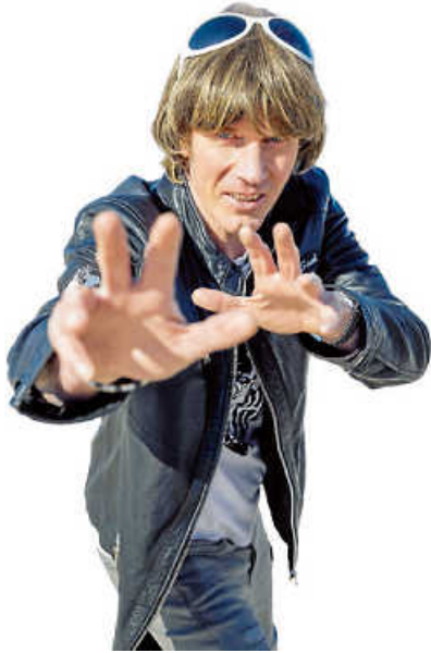
Ein Publikumsmagnet: Schlagerstar Mickie Krause bringt den „Ballermann“ nach Sielmingen.