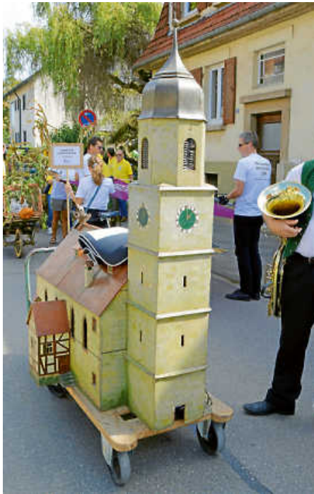
Sielmings Kirchturm „on tour“.