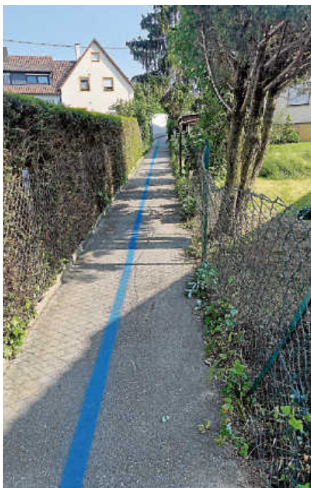
Eine blaue Linie zieht sich derzeit durch Sielmingen.

Dieses Jahr wird in Sielmingen nicht „irgendein“ Stadtteilfest gefeiert: Vor einhundert Jahren – genauer 1923 – wurden die beiden Orte Obersielmingen und Untersielmingen zusammengelegt. Und ein weiteres Jubiläum steht bereits an: 2024 feiert Sielmingen 750 Jahre. Dazu soll es einen Festakt geben. Wenn das kein weiterer Grund zum Feiern ist!