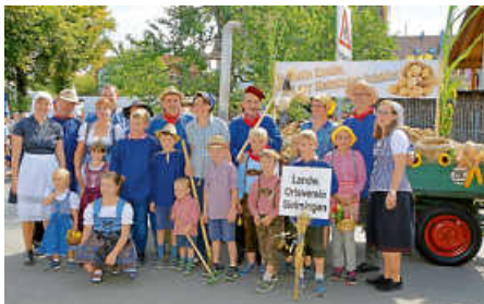
Impressionen vom Festumzug 2018...

Alle fünf Jahre ist es so weit: Sielmingen feiert Heimatfest. Vom 8. bis 11. September 2023 steigt an der Seestraße auf dem „neuen“ Festplatz eine große Party für alle Generationen. Die Arbeitsgemeinschaft (ARGE) Sielminger Vereine und die Stadtverwaltung laden große und kleine Gäste aus ganz Filderstadt sowie aus nah und fern herzlich zum Mitfeiern ein.