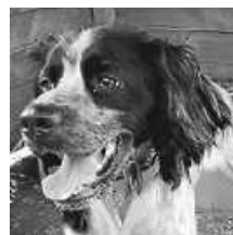
Er ist verträglich und verspielt mit Artgenossen und kann daher auch als Zweithund im neuen Zuhause einziehen. Sogar mit Katzen kommt der freundliche Bub gut zurecht. Für einen Jagdhund zeigt Totò eine gute Leinenführigkeit und ist ein perfekter Begleiter für ausgedehnte Spaziergänge. Wer kann dem hübschen Buben ein Körbchen anbieten?

auch sein größtes Thema, weshalb eine Vermittlung bisher nicht zustande kam, denn das Alleinebleiben muss zunächst erstmal geübt werden. Ansonsten ist Totò ein toller Begleiter.