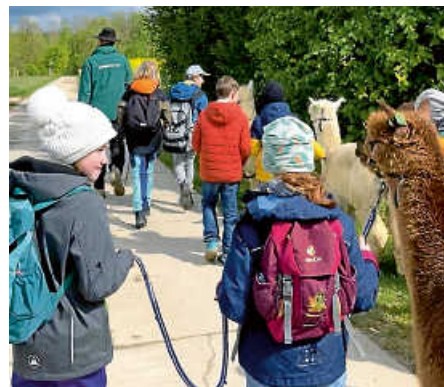
Auf Wanderschaft mit den Alpakas.