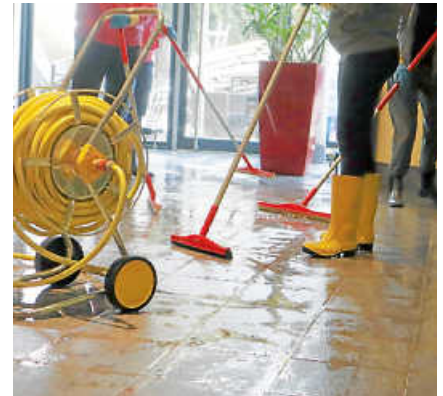
Alles wird auf Hochglanz geschrubbt.

Die Eröffnung der Freibadsaison erfolgt in Kürze. Die Becken werden noch befüllt und „beprobt“. Nach dem „Go“ werde, so Felix Schneider, der Freiluftbereich vermutlich Mitte/Ende Mai aufmachen – und dies ohne Erhöhung der Freibad-Preise! (ih)