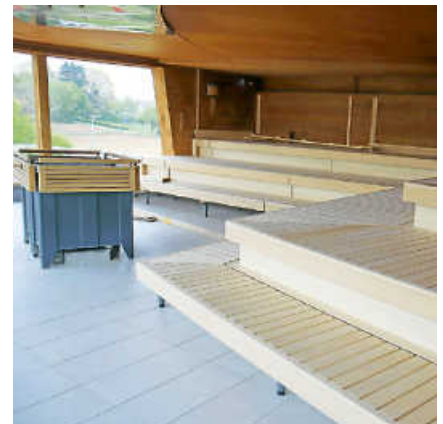
Die Panoramasauna hat neue Holzbänke erhalten.