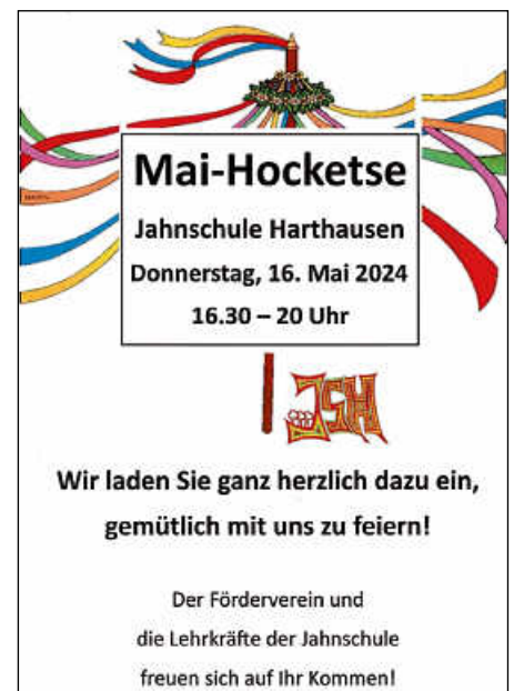
Plakat: B. Bazarkaya