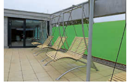
(Von links nach rechts) Leuchttürme als neue Umkleiden für den Kinderbereich des Freibads. Gips und Fugenmasse für den Fliesenboden. Die Schwing Schaukeln im Saunabereich laden zum Relaxen ein.