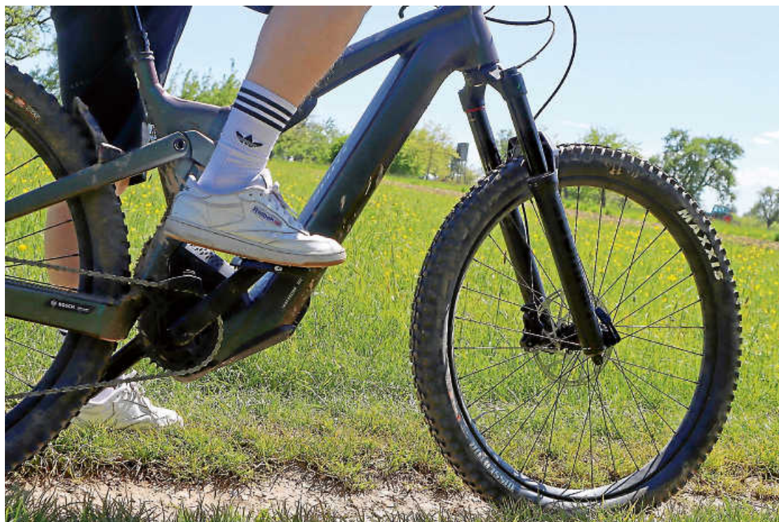
Die Fahrradsaison hält 2024 vieles bereit. Also nichts wie rauf auf die Räder, fertig, los!