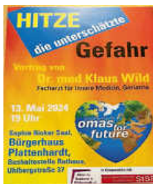
Plakat: Omas for future

Die Veranstaltung von „Omas for future“ am 13.5.24, 19 Uhr im Sophie-Rinker-Saal im Bürgerhaus Plattenhardt mit dem Vortrag „Hitze, die unterschätzte Gefahr“ mit Dr. med. Klaus Wild ist ein Beispiel dafür. (Diethelm Boldt)