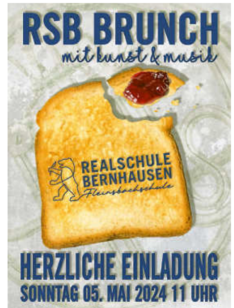
Plakat: S. Conrad