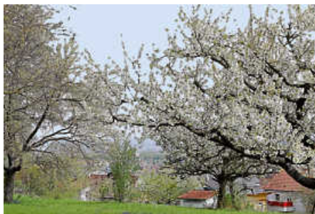
Streuobstwiesen zählen nach Feuchtwiesen zu den klimaaktivsten Flächen, sie speichern mehr CO 2 als ein Wald.

Heute gibt es Streuobst in Filderstadt nur noch auf einer Fläche von 250 Hektar, es war mal sehr viel mehr. In Baden-Württemberg ist der Bestand seit 1965 etwa um die Hälfte zurückgegangen. Die Gründe dafür sind vielfältig: Streuobstwiesen – landschaftsprägend seit dem 19. Jahrhundert – mussten Wohngebieten, Straßen und Äckern weichen, zudem war die Industrialisierung der Landwirtschaft auf dem Vormarsch. Zu wenig Ertrag, kaum gewinnbringende Vermarktung und Überalterung der Eigentümer*innen führte (und führt) zur Aufgabe der Grundstücke. Jüngere Generationen haben oftmals kein Interesse an der arbeitsintensiven Pflege der Anlagen, zumal „diese zu 90 Prozent im Landschaftsschutzgebiet liegen“, wie Arold sagt, und damit auch nur sehr eingeschränkt für Freizeitaktivitäten mit der Familie genutzt werden können.