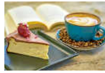
Literarisches Frühstück

Bei einem gemütlichen Frühstück werden am Donnerstag, 16. Mai 2024, von 9:30 bis 11 Uhr neue Romane vorgestellt und Lesetipps gegeben. Der Unkostenbeitrag für das Frühstück beträgt fünf Euro, um eine Anmeldung bis 11. Mai unter Telefon: 0711/7003-451 oder per E-Mail an: bibliothek@filderstadt.de wird gebeten. In Kooperation mit dem Bunten Bücherladen, Bernhausen.